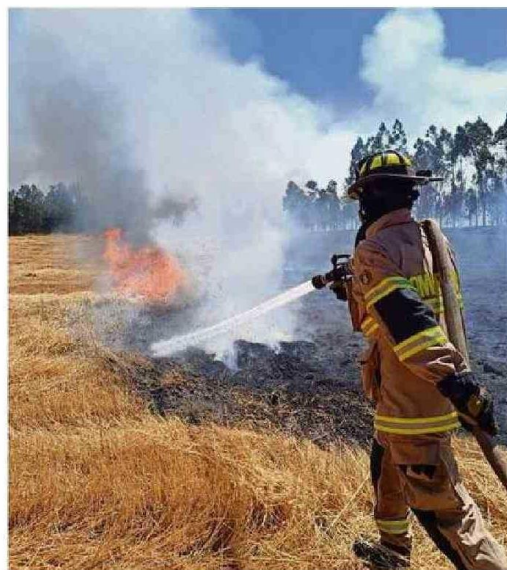
EXTENUANTES HAN SIDO ESTOS DÍAS PARA BOMBEROS DE PAILAHUEQUE.

El Austral pudo confirmar que Bomberos de la Región de Los Ríos salieron anoche en apoyo a La Araucanía, despatchándose seis carros: Lanco, Valdivia, Río Bueno, Paillaco, Máfil y Panguipulli.