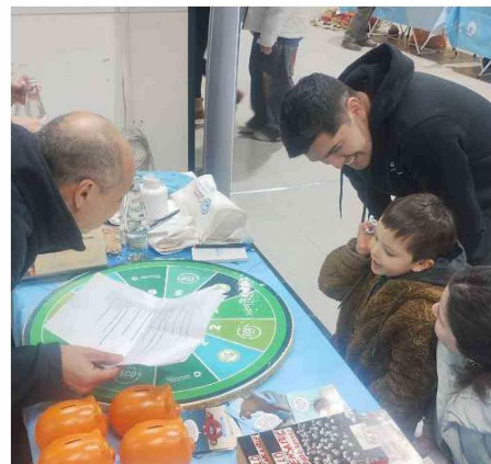
Los niños fueron protagonistas de un nuevo “Eco canje”

Christian Jiménez cijimenez@elpinguino.com