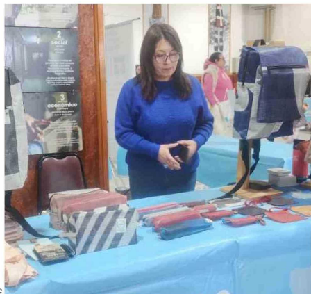
“Puro viento” exhibió sus mochilas fabricadas utilizando gigantografías.

● Instancia organizada por la Municipalidad de Punta Arenas convocó a más de 800 personas, quienes tuvieron la oportunidad de conocer nuevos modelos de negocios de carácter sustentable,