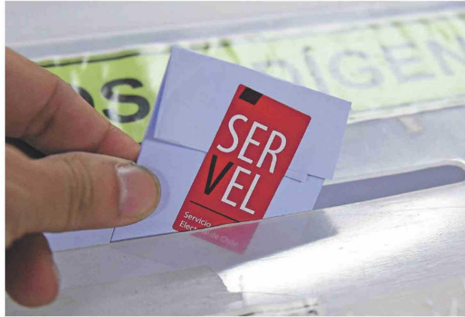
El voto en esta elección es obligatorio: hay multa por no asistir al local asignado.

Tagle enfatizó en que la gente se entere con antelación "sobre los candidatos por los que va a votar, para agilizar el proceso", dado que algunas papeletas, como las de concejales y cores, pueden tener decenas de candidatos. Esos datos están disponibles en https://consulta.servel.cl/ , donde además encontrará