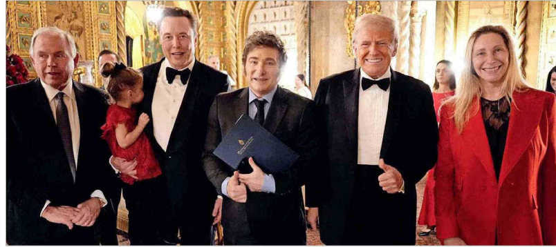
Milei y su hermana Karina, fueron invitados especiales por Trump al cambio de mando, así como Elon Musk, el nuevo zar de la "eficiencia gubernamental".

Y las proyecciones son positivas. El Fon-