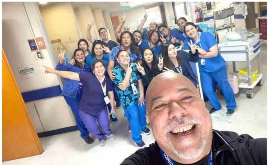
Cambio del hospital viejo, al nuevo Hospital de Curicó.