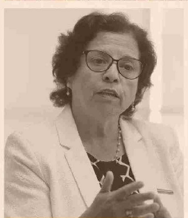
AURORA WILLIAMS, MINISTRA DE MINERÍA.