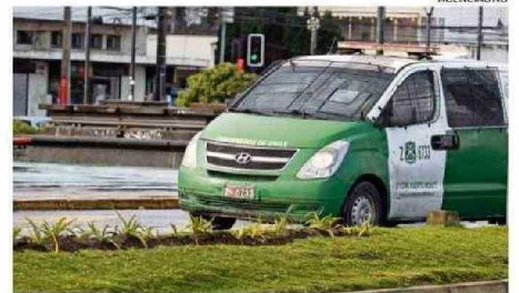
LA DELINCUENCIA ES EL MAYOR TEMOR DE LA REGIÓN.

zan las municipalidades, solo el 13% de las personas le coloca un 6 o 7 a la labor que efectúan. Vallespín señala que le llama la atención este descontento, puesto que los municipios son en los sectores más alejados la entidad más cercana que tiene la comunidad, entonces “que exista este descontento creo que se debe tomar nota de esa preocupación”.