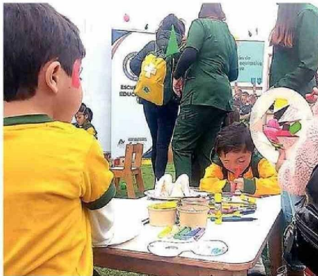
LO MEJOR ES IR A ACTIVIDADES AL AIRE LIBRE.

Una de las primeras recomendaciones que entregó a los padres es privilegiar actividades en espacios al aire libre, como plazas o parques. “Pero sabemos que eso no es posible siempre, por lo cual tene-