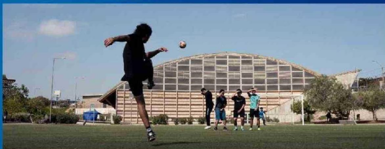
Complejo Deportivo Integral UTA.