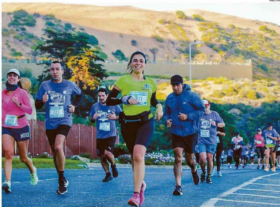
LA COMUNA DE CONCÓN ESTÁ ENTRE LAS MEJORES DEL PAÍS EN CUANTO A CALIDAD DE VIDA URBANA.

Ya con la mira local, entre las comunas de áreas metropolitanas de la Región de Valparaíso, Concón se mantiene en el nivel “alto” en cuanto a calidad de vida urbana, mientras que Viña del Mar, Quilpué y Vi-