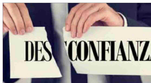
"La desconfianza frente a la norma, a lo convencional, fue lo que permitió el cambio".

Individuos como Copérnico y Galileo, que cambiaron el dogma oficial de la Iglesia sobre la astronomía. "Personas que hoy son las que reclaman a los gobiernos por su responsabilidad en el cambio climático,