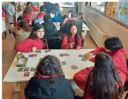
Alumnos del colegio Altamira de Coyhaique probaron el juego.

te que primero logre reunir cuatro "colecciones".