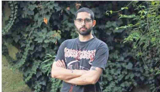
“ME PARECIÓ MÁS BIEN UN DEBER PUBLICAR ALGO PARA QUE SE HABLE DEL TEMA” DE LA SALUD MENTAL, DICE EL AUTOR.

—Todo el mundo, los psiquiatras, los cuidadores, los enfermeros en esa época, yo creo que no ha cambiado, eran bien tontos, ponen como antecedentes cosas que no tienen nada que ver, o sea, que me hayan puesto que escuchaba heavy metal como antecedente psiquiátrico es realmente una tontería. Lo que sí, lo de los susurros era caótico porque tenía alucinaciones, pero provocadas por los fármacos que ellos me daban. Y lo de pensar en la muerte es porque quién no piensa en eso, (... dicen) “está pensando en la muerte, en-