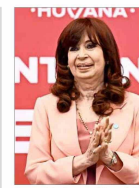
Exmandataria no podría postular por una condena por corrupción, que todavía puede ser recurrida.

LAS CLAVES DEL PROCESO QUE RECIENTE COMIENZA | A 4 EDITORIAL | A 3 COLUMNA DE OPINIÓN | A 2