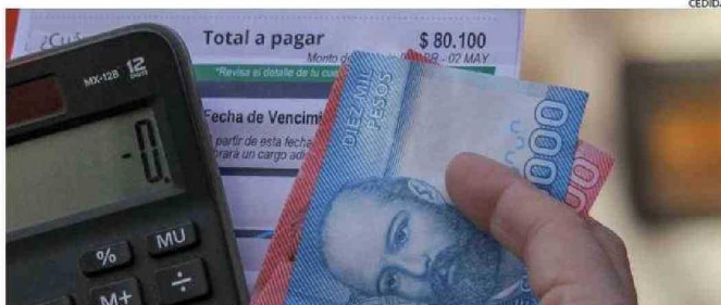
LAS CUENTAS TENDRÁN UN ALZA A PARTIR DE ESTE MES DE JULIO Y HASTA EL 2035 SE MANTENDRÁN.

las alzas en las cuentas de la luz que recibirán los clientes en sus hogares, lo que tendrá distintos impactos en la economía del hogar y del país.