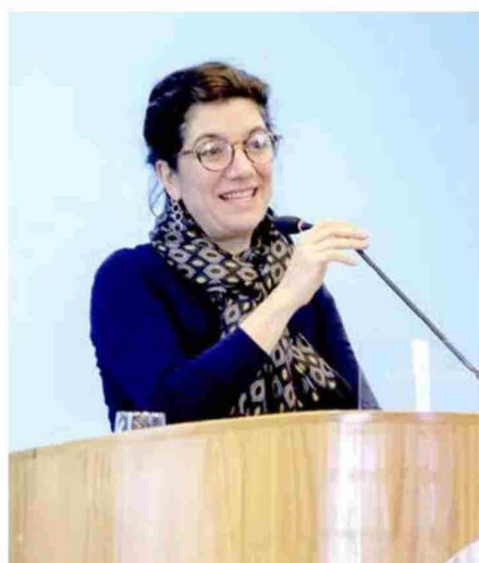
Ministra de Ciencia, Aisén Etcheverry.

Titular de Ciencia. La autoridad de Gobierno participó en el seminario Ciencia en el Aire y que además, contó con exposiciones de importantes divulgadores científicos.