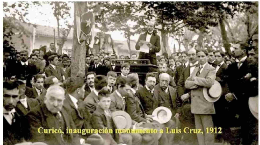
Curicó, inauguración monumento a Luis Cruz, 1912