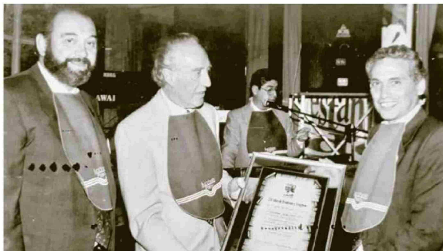
La Prensa recibió el reconocimiento de la Municipalidad de Curicó, por apoyar el programa "Curicó: 250 Años de Tradición y Progreso", en 1993.