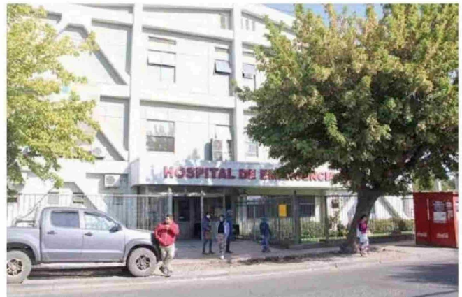
Un centro de salud en dependencias del Hospital de Emergencia, sigue siendo una necesidad apoyada por diario La Prensa.