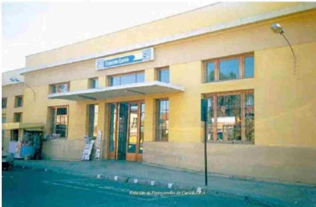
La comunidad, a través de este diario, exigió por años la reposición de la Estación de Ferrocarriles, hoy en plena construcción.

Tiraje: 4.200 Lectoría: 12.600 Favorabilidad: No Definida