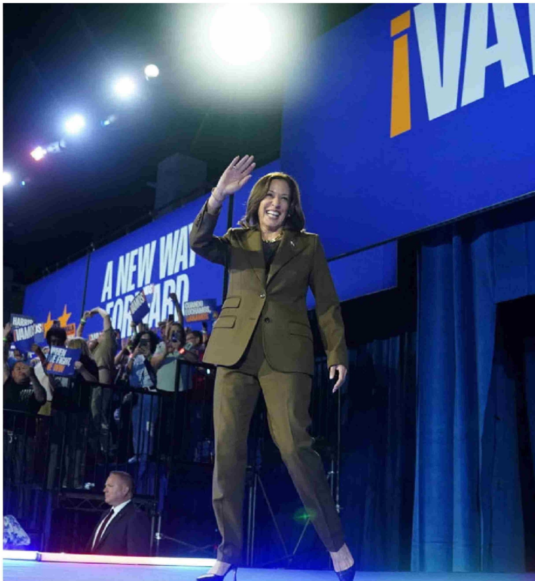
► Kamala Harris, hace un gesto en Las Vegas, Nevada, el 29 de septiembre.