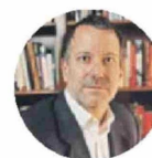
MARIO MARCEL Ministro de Hacienda

Vá a generar más disponibilidad de fondos para financiar proyectos de inversión y financiar proyectos de vivienda”.