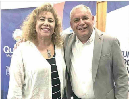
La alcaldesa Verónica Rossat interpuso un reclamo en contra de Vialidad por el mal estado de los caminos rurales en la comuna, por lo que el gobernador Rodrigo Mundaca se comprometió a contactarse con este organismo para buscar una solución.

comunidad seguirá atenta a las respuestas y acciones que se tomen durante las próximas semanas, mientras la presión de las autoridades locales y los vecinos persiste para asegurar un entorno más seguro y digno para todos.