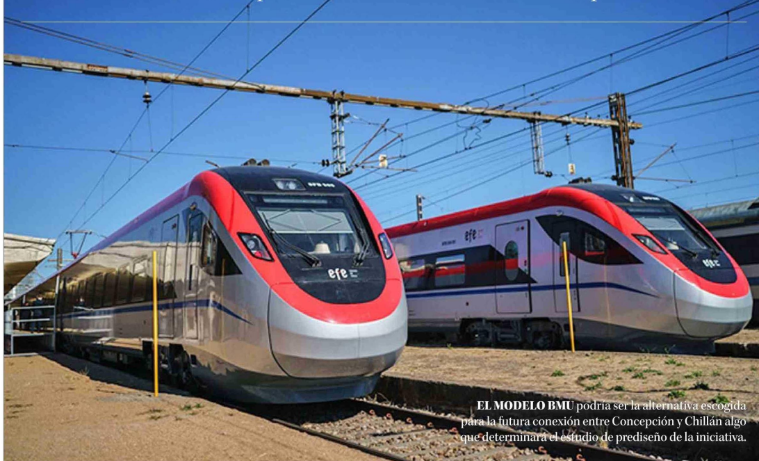
EL MODELO BMU podría ser la alternativa escogida para la futura conexión entre Concepción y Chillán algo que determinará el estudio de prediseño de la iniciativa.

Luego de declararse desierto el primer llamado para contratar empresa que desarrollará el estudio, Sectra abrió por segunda ocasión el proceso para adjudicarlo. Entre los resultados debe identificarse el mejor trazado y la infraestructura necesaria para materializar la conexión Concepción-Chillán.