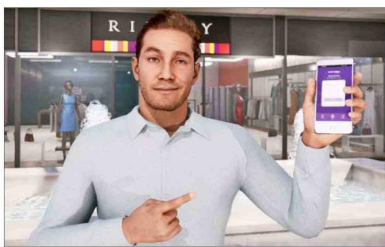
"Lukas", un avatar creado con IA para ofrecer educación financiera "personalizada y accesible".

antes de Chile. "Acá nadie nos pescaba, nos encontraban caros y decían que estábamos locos", relata como anécdota. "Pero acá ya está llegando, por varios lados", analiza y dice que están "metiéndole a full" con este tema, que espera que sea la tendencia de este año.