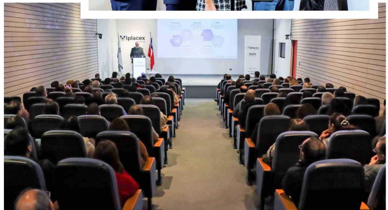
Durante la cuenta pública de Iplacex, el rector de la institución dio cuenta que las matrículas crecieron en un 19,4% durante el año pasado.