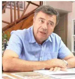
Esteban Valenzuela, ministro de Agricultura.

El timonel de Frutas de Chile manifestó que “no se entiende que el sector frutícola nacional crezca sin precedentes, con beneficios económicos para todo el país, y paradójicamente, se tomen decisiones que van en desmedro de su desarrollo,