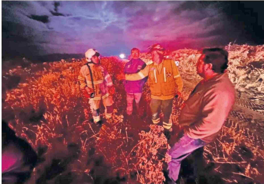
Parte de los múltiples focos han ocurrido por la noche.

“Lo que estamos a haciendo es parecido a lo que hicimos en el ataque frontal al robo de madera: mapear los lugares donde ocurre el ilícito, la forma en que se genera, los días y horarios probables en que se desarrollan y dónde están generando-se la venta de esos productos”