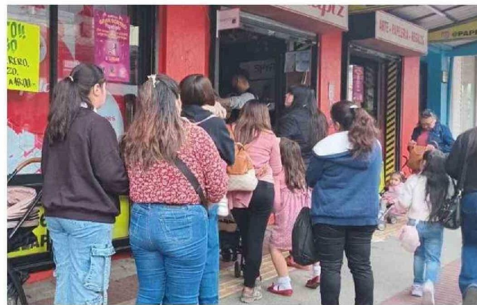
PARTE DEL COMERCIO CERRÓ, MIENTRAS USUARIOS ESPERABAN QUE EL SERVICIO VOLVIERA A LA NORMALIDAD.

Ante la magnitud del evento, se activó un Cogrid regional a las 16:00 horas en la capital regional para coordinar las res-