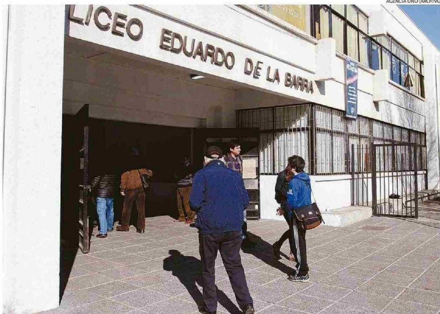
PRINCIPAL DESAFÍO DEL LICEO PORTEÑO, SEGÚN SU DIRECTORA, ES HACER PARTE A LAS FAMILIAS DE LAS TRAYECTORIAS EDUCATIVAS.

“Nuestros y nuestras estudiantes subieron mucho sus puntajes, así que estamos muy contentos, porque creemos que se empieza a consolidar un proceso postpandémico que nos costó mucho, con hartos rezagos a raíz de situaciones de salud mental, por lo tanto, no ha sido fácil retomar, sin embargo, hoy día estamos contentos con los resultados”, declaró la di-