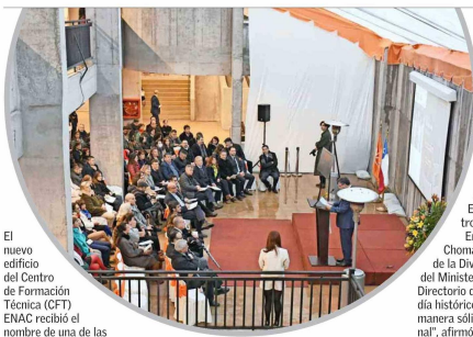
El nuevo edificio del Centro de Formación Técnica (CFT) ENAC recibió el nombre de una de las fundadoras de la Cruzada de Caritas Chile, Mercedes Esquerra.