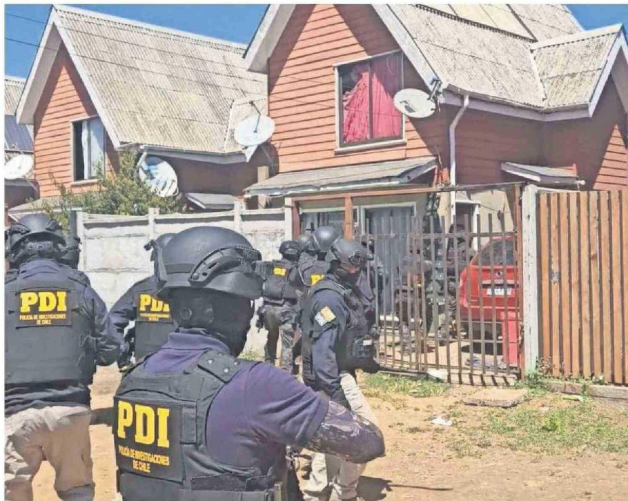
Para el operativo se desplazaron más de 200 detectives de regiones de la zona centro sur.

Los detectives realizaron 31 allanamientos que terminaron con la captura de 23 personas. De estas, 21 fueron formalizadas quedando con medidas cautelares. El Ministerio Público plantea que los sujetos utilizaban las baterías para abastecer de energía a la toma Punta de Parra.