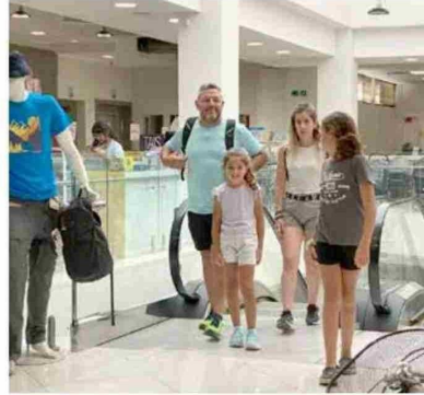
Familias argentinas llegaron masivamente a Talca durante el verano. Sus principales destinos eran los centros comerciales, porque el cambio monetario les favorecía mucho.

Por motivo del fin de semana largo en Argentina, desde el viernes 28 de febrero hasta el domingo 2 de marzo, se vio un aumento considerable del flujo migratorio de pasajeros en el Paso Internacional Pehuenche. La información fue dada a conocer por el jefe del Depar-