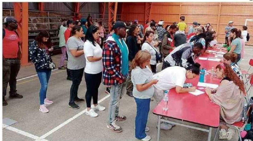
ESPERAN CONFORMAR 32 COOPERATIVAS Y LUEGO UNA FEDERACIÓN PARA NEGOCIAR.

Tras el acuerdo alcanzado entre el Gobierno y los dueños del terreno de 254 hectáreas el pasado lunes que frenó por 6 meses el desalojo, continuaron las