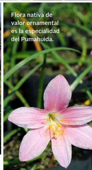
Flora nativa de valor ornamental es la especialidad del Pumahuída.

Con el tiempo, sumaron especies introducidas de igual requerimiento y que se asocian muy bien a las nativas, como romeros, lavandas u olivos.