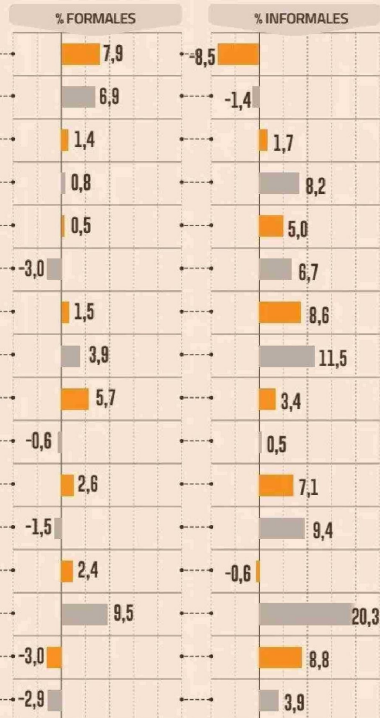
CRECIMIENTO ANUAL DE OCUPADOS FORMALS E INFORMALES POR REGIÓN AL II TRIM.

yor informalidad laboral estarían asociadas entre otros factores con mayores niveles de pobreza, menor escolaridad, mayor participación de ocupados en ramas de mayor informalidad como agricultura, comercio y construcción”, señaló el documento.