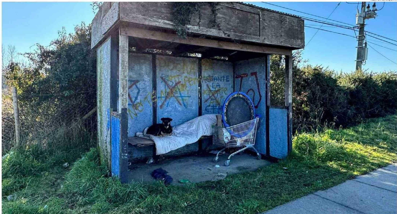
ESTA IMAGEN FUE CAPTADA AYER EN LA MAÑANA CUANDO LA TEMPERATURA ERA DE UN GRADO BAJO CERO. ESTA PERSONA EN SITUACIÓN DE CALLE ACOMPAÑADA DE SU MASCOTA, PERNOCTA EN ESTA PARADA EN LA RUTA 7.