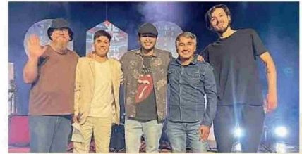
Al Otro Pueblo

Voy tomando la rompehuesos Voy camino a mi Hogar Me haré unos tomates y me iré a caminar A La Huinca a caminar Mi Limache mi Limache Nos volvemos a encontrar No quisiera separarme de mi pueblo nunca más