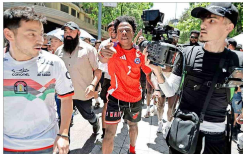
Darren Jason Watkins Jr., conocido como Speed (al centro), junto a su equipo durante su transmisión en vivo por las calles de Santiago el pasado 23 de enero.

do un fenómeno que, si bien ya tenía una base consolidada, experimentó una aceleración significativa en el mundo pospandemia".