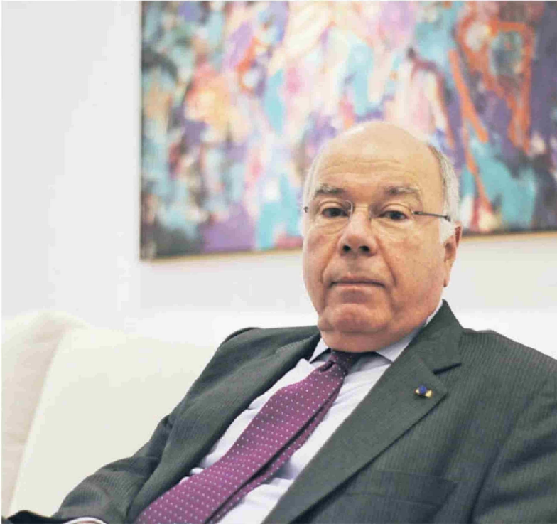
► El canciller de Brasil, Mauro Vieira, durante una entrevista con La Tercera, en enero pasado.