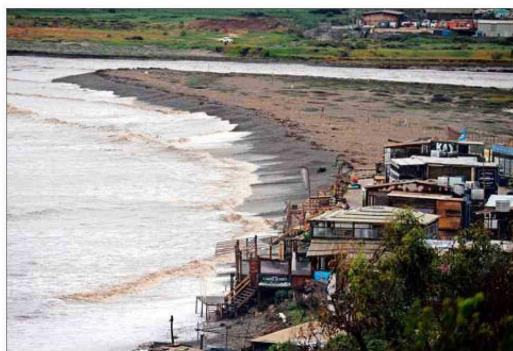
EVACUACIÓN. — Un total de 80 casas fueron evacuadas por la amenaza del desborde del río Aconcagua.

están en el lugar siniestrado. A esto se sumó un nuevo socavón, esta vez en un condominio en Curauma.