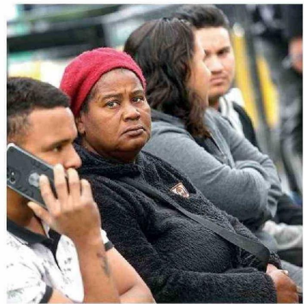
LA REGIÓN CONCENTRA CASI 60 MIL MUJERES MIGRANTES.

Este fenómeno de la baja natalidad chilena se ha ido