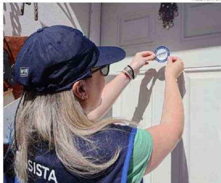
DOS MIL CENSISTAS SE DESPLGARON POR LA REGIÓN DURANTE 2024.