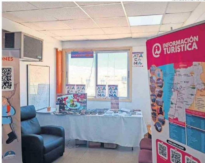
DESDE ESTA TEMPORADA EXISTE UN PUNTO DE INFORMACIÓN TURÍSTICA EN LA ADUANA CHILENA.

Es que a raíz de las medidas para enfrentar la pandemia de COVID-19, el paso que une Atacama con Catamarca, en Argentina, llegó a estar completamente cerrado y su reapertura ha sido lenta. De hecho, recién cuando estén las cifras de ingresos y salidas de febrero podrá comenzar a evaluarse su impacto, pues solo el 3 de febrero pasado la aduana retomó su actividad diaria, que había tenido en esas mismas condiciones en la década pasada, antes de la pandemia, con un peak de uso en los años en que el Rally Dakar pasó por la región y atrajo a visitantes trasandinos apasionados a los motores. ☞