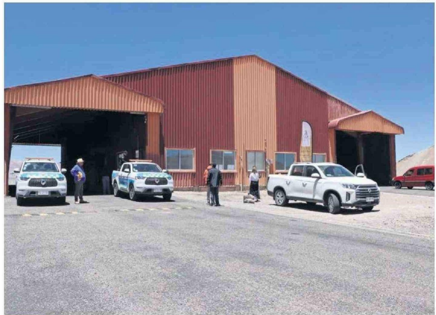
EL PASO SAN FRANCISCO ES LA GRAN ENTRADA POR TIERRA DESDE ARGENTINA A LA REGIÓN DE ATACAMA Y AHORA FUNCIONA TODOS LOS DÍAS.