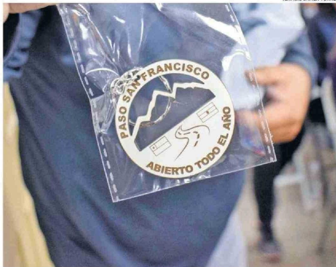
LOS GREMIOS TURÍSTICOS HAN PROMOVIDO LA APERTURA TODO EL AÑO DEL PASO SAN FRANCISCO.

7 días a la semana funciona el Paso San Francisco desde el 2 de febrero pasado, cuando se concretó esa sentida aspiración de los gremios turísticos de la región.