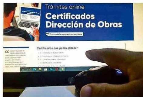
AVANZAR EN TRÁMITES EN LÍNEA ES UNA TAREA DE LOS MUNICIPIOS.

0,597; sin embargo, en el municipio digital tiene un nivel Medio Bajo con 0,475 y en educación digital marca un nivel Bajo 0,423.