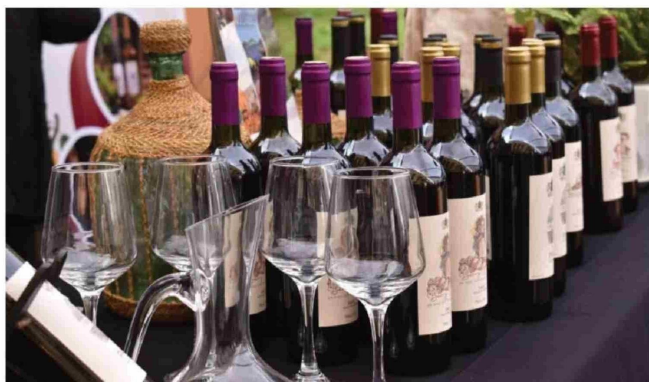
EL VALLE DEL BIOBÍO está marcado por el río del mismo nombre para elaborar vinos únicos y de alta calidad.