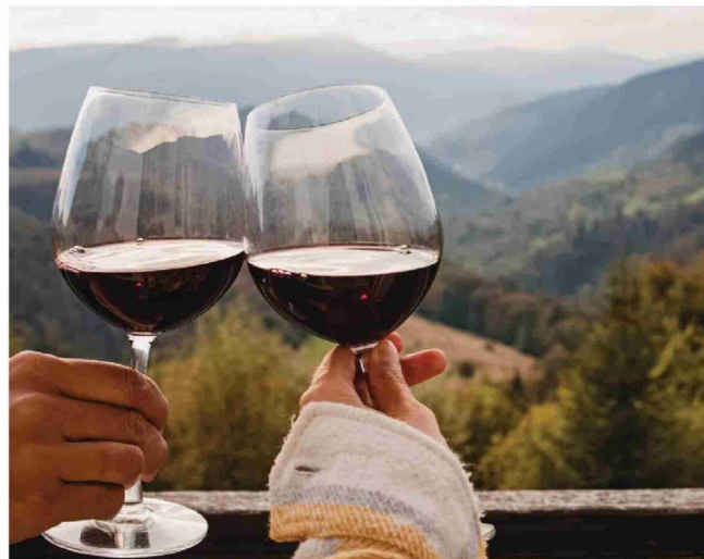
LAS CARACTERÍSTICAS ÚNICAS del valle del Biobío abren las puertas para desarrollar el potencial de producción vitivinícola.

Uno de los grandes desafíos que enfrenta el sector vitivinícola en Biobío es la consolidación de su imagen como una región productora de vinos de excelencia. A diferencia de zonas tradicionalmente reconocidas como el Valle de Colchagua o el Valle del Maipo, Biobío todavía debe trabajar en posicionarse dentro de los referentes del vino chileno. Sin embargo, la calidad creciente de sus vinos, la diversidad de cepas cultivadas y el compromiso de sus productores están