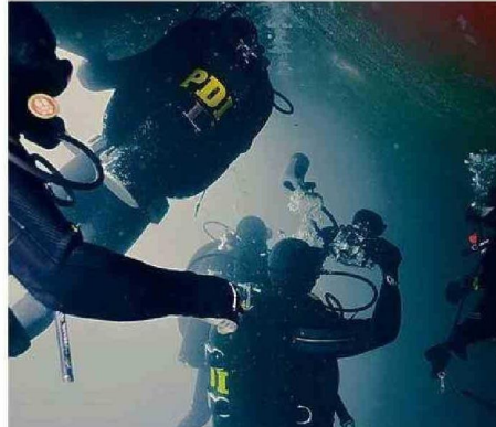
SE ORIGINA EN EL AÑO 2010. REGISTRAN 350 PROCEDIMIENTOS.

La Deosub mantiene jurisdicción a lo largo del territorio nacional. Gracias a su enfoque especializado, explica su jefe de Brigada,