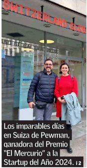
Los imparables días en Suiza de Pevman, ganadora del Premio "El Mercurio" a la Startup del Año 2024. 12

LA ESTRATEGIA DE LISA PLAGGEMIER, DIRECTORA EJECUTIVA DE LA ALIANZA NACIONAL DE CIBERSEGURIDAD DE EE.UU., PARA EDUCAR SOBRE RIESGOS DIGITALES SIN RECURRIR AL MIEDO. 17