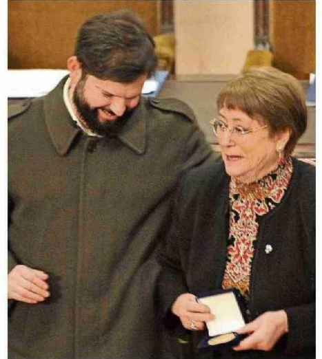
EL PRESIDENTE BORIC JUNTO A LA EXPRESIDENTA BACHELET, AYER, EN UN ACTO DEL CONSEJO DE RECTORES.