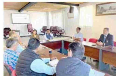
Los representantes de la Red de Emergencia, junto con expertos en la materia, presentaron un plan de acción con medidas preventivas y reactivas para enfrentar la situación.

de la empresa... Y ser garantes que vamos a respaldar todas las acciones tendientes a prevenir, pero también buscar responsables. La colaboración entre todos los actores involucrados es esencial para mitigar este riesgo y evitar que estos incendios se sigan repitiendo", acotó el jefe comunal. Asimismo, el jefe comunal reafirmó su compromiso con la comunidad, y aseguró que se continuará trabajando de manera intensiva para solucionar esta problemática, que ha afectado a