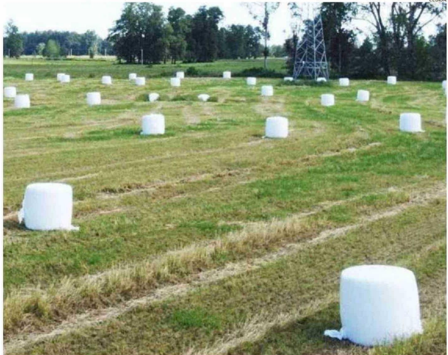
ESTA TEMPORADA LAS PRADERAS HAN TENIDO UN BUEN RENDIMIENTO, POR LO QUE SE VAN A ENVASAR MUCHOS BOLOS.

“Es un tremendo alivio, porque antes incluso terminaba quemándolos, porque eran