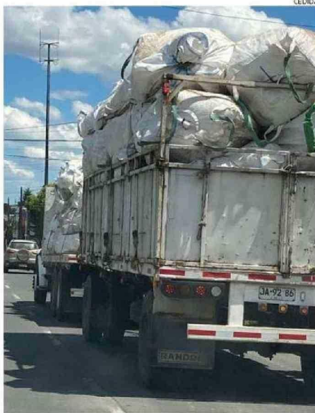
EN PROMEDIO, UN PLÁSTICO DE BOLO PESA TRES KILOS.

que se dedican al retiro y reutilización de este material hay en el país y en la región, específicamente, no son más de 10, por lo que son una real necesidad para los agricultores.