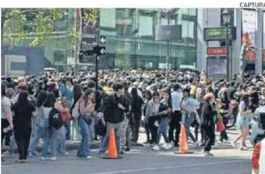
ACTIVIDAD SE REALIZÓ POR EL DÍA NACIONAL DEL TULIPÁN.