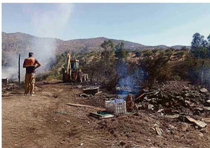
DESDE LA MUNICIPALIDAD YA SE ENCUENTRAN REMOVIENDO ESCOMBROS.